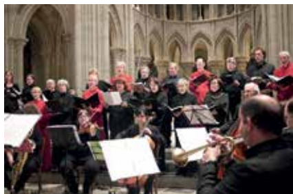
L'Ensemble vocal & instrumental Cappella Cluniacensis,