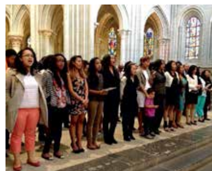
6 juin 2013. La chorale intercommunautaire