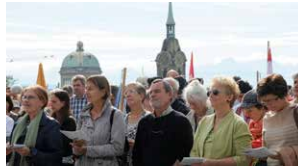
Rassemblement des Eglises sur la place fédérale, Berne, 14.9.2013

Unions d'Eglises membres du Réseau évangélique suisse : Armée du Salut, Association vaudoise d'Eglises évangéliques, Conférence Mennonite Suisse, Eglises Évangéliques Apostolique Romande, Fédération d'Eglises et Communautés du Plein Evangile, Fédération romande d'Eglises évangéliques, Union des Assemblées Missionnaires, Union des Eglises Chrischona Suisse, Union des Eglises Evangéliques de Réveil